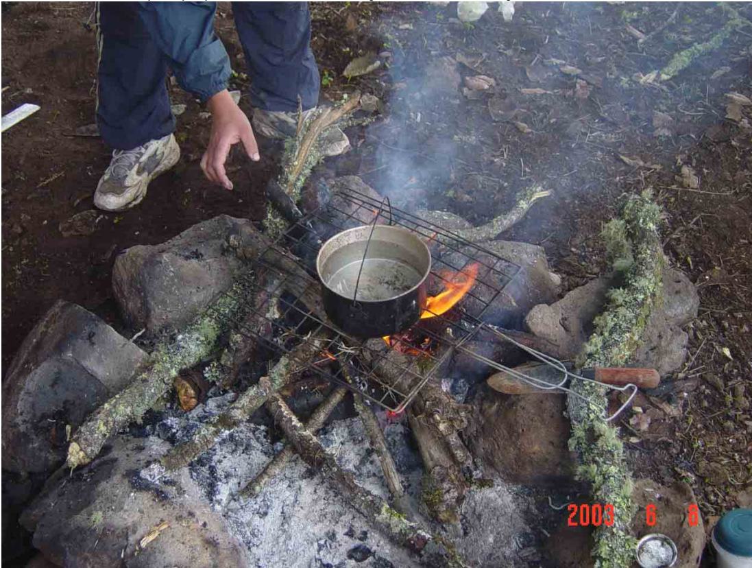
Debido a la lejanía de la camioneta, emprendimos el regreso desde temprano...